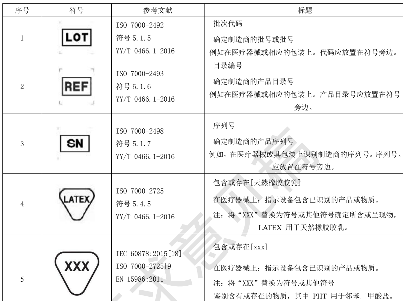
表 201.D.2.101 标记补充的符号